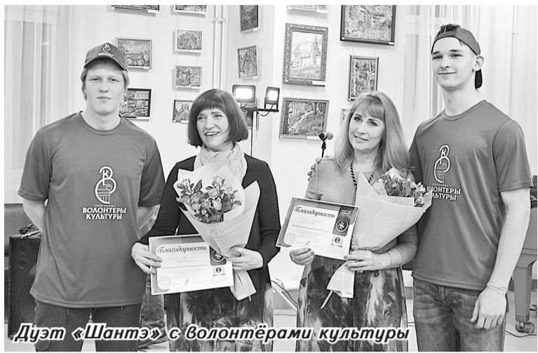
Дуэт «Шантэ» с волонтерами культуры