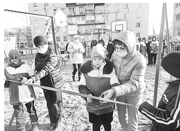
Красная ленточка разрезана!