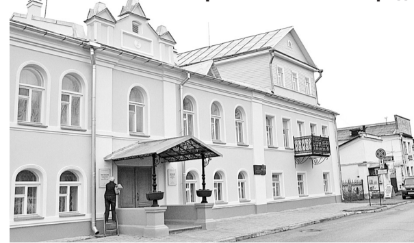
Музей истории города Боровичи

Продолжается реставрация зданий в исторической части города